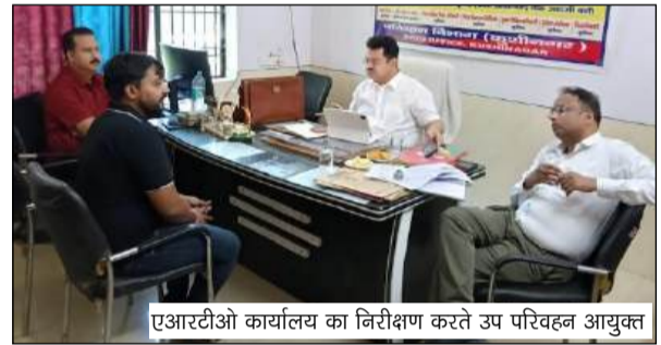
एआरटीओ कार्यालय का निरीक्षण करते उप परिवहन आयुक्त

समीक्षा बैठक में जानकारी दी गई कि जनपद में 203 स्कूली वाहनों के