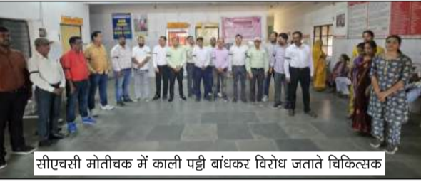
सीएचसी मोतीचक में काली पट्टी बांधकर विरोध जताते चिकित्सक

बताया जाता है कि बीते मंगलवार को अहिरोली बाजार थाना क्षेत्र निवासी एक युवक की सर्पदंश से मौत हो गई थी। परिजन उसे उपचार के लिए सीएचसी देवतल सुकरौली ले गए थे। इसी दौरान उपचार में देरी और