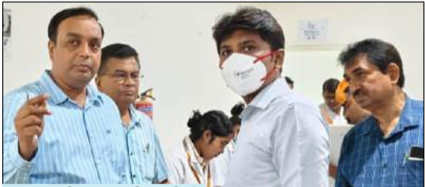
■ मुख्य विकास अधिकारी ने जिला अस्पताल का किया निरीक्षण

इस दौरान उन्होंने अस्पताल द्वारा प्रदान की जा रही स्वास्थ्य सेवाओं की विभिन्न पटल ओपीडी, सहित अन्य पटल की भ्रमण कर विस्तृत जानकारी प्राप्त की गई। निरीक्षण के दौरान मुख्य विकास अधिकारी ने अस्पताल में उपचार की गुणवत्ता, दवाओं की उपलब्धता, चिकित्सकीय स्टाफ की स्थिति, समयबद्ध उपचार व्यवस्था तथा आपातकालीन सेवाओं की कार्यप्रणाली के संबंध में जानकारी प्राप्त की। उन्होंने स्पष्ट निर्देश दिए कि मरीजों को किसी भी प्रकार की अस्वस्थता न हो और सभी सेवाएं प्रभावी ढंग से संचालित की जाएं।