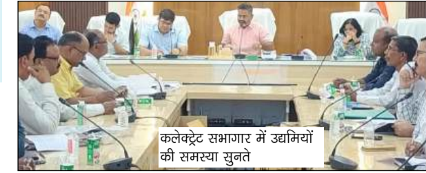
कलेक्ट्रेट सभागार में उद्योगियों की समस्या सुनते

जईछर्रा (नौरिंगिया) स्थित युड उद्योग इकाई के संपर्क मार्ग पर अतिक्रमण घटने के मामले में राज्यस्तर विभागा पड़ौना ने बताया कि नायब तहसीलदार की अध्यक्षता में टीम गठित कर दी गई है और जल्द ही जांच कर कार्रवाई की जाएगी। मेसर्स उदम पब्लिक स्कूल, हनुमान कॉलोनी, बकुलहा रोड, पड़ौना के विद्यालय परिसर से सटे विद्युत तार को हटाने के मामले में विद्युत विभाग ने जानकारी दी कि तार शिफ्ट करने के लिए पोल लगाए जा रहे हैं और एक सप्ताह के भीतर कार्य पूरा कर लिया जाएगा। मिनी औद्योगिक आस्थान सराटाटी कनरपट्टी (दुदही) में विद्युत आपूर्ति सुधार के संबंध में सविनियोजित सोड का पुनः आकलन करने का निर्णय लिया। इस पर जिलाधिकारी