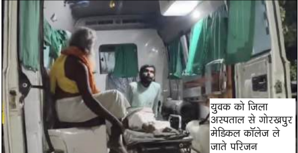
युवक को जिला अस्पताल से गोरखपुर मेडिकल कॉलेज ले जाते परिजन