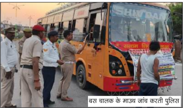
बस चालक के माउथ जांच करती पुलिस