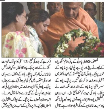
سسراروند سنگھ بشت کی یادگاری تقریب

نم آنکھوں کے درمیان پرتیک یا دو کی آخری رسومات ادا سسراروند سنگھ بشت نے دی 'مکھاگنی' پر ایک یادگاری تقریب منعقد کی