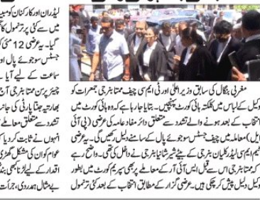
جج کی عدالت میں شرکت

انتخاب کے بعد ہونے والے تشدد معاملے کو کرپشن کی پٹیوں میں لپیٹ کر رکھا گیا