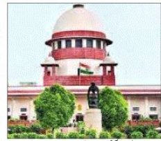
سپریم کورٹ کی عمارت، نئی دہلی

واضح ہے کہ 2023 میں سپریم کورٹ نے اپنی ایک 1:2 کی اکثریت میں ہمیشہ حکومت کا پلڑا رہا گہاہاری * جب فیصلہ حکومت کو ہی کرنا ہے تو کمیٹی میں اپوزیشن لیڈز کو رکھنے کا دکھاوا کیوں؟ الیکشن کمیشن کا خود مختار نظر آنا بھی ضروری، معاملہ بڑی ہنج بھنجے ہوئے پر غور