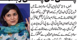
ایک عورت کی تصویر ہے۔ انہوں نے کہا ہے کہ انہوں نے 21 مئی (جے ایم ایف آئی) کے خلاف سولہ ماہ سے احتجاج کیا ہے۔

میں 21 مئی (جے ایم ایف آئی) کے خلاف سولہ ماہ سے میں 21 مئی (جے ایم ایف آئی) کے خلاف سولہ ماہ سے میں 21 مئی (جے ایم ایف آئی) کے خلاف سولہ ماہ سے