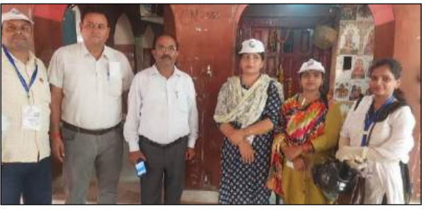
सूचीकरण एवं गणना कार्य की सटीकता अत्यंत महत्वपूर्ण है।

अमेठी। भारत की जनगणना 2027 के अंतर्गत प्रथम चरण में शुक्रवार 22 मई 2026 से जनपद में मकान सूचीकरण एवं मकानों की गणना का कार्य विधिवत रूप से प्रारंभ कर दिया गया। इस महत्वपूर्ण अभियान के तहत नियुक्त प्रणालक एवं सुपरवाइजर घर-घर जाकर मकानों का सर्वेक्षण करते हुए सूचीकरण और गणना का कार्य कर रहे हैं। जिला प्रशासन ने इस कार्य को गंभीरता एवं शत-प्रतिशत सफलता के साथ संपन्न करने के निर्देश दिए हैं ताकि कोई भी मकान गणना से वंचित न हो जाए। जिला प्रशासन के अनुसार जनगणना देश के विकास की आधारभूत प्रक्रिया है जिसके माध्यम से जनसंख्या आवासीय स्थिति संसाधनों और सामाजिक-आर्थिक परिस्थितियों से संबंधित महत्वपूर्ण आंकड़े संकलित किए जाते हैं। इन आंकड़ों का उपयोग भविष्य की योजनाओं सरकारी नीतियों तथा जनहितकारी कार्यक्रमों के निर्माण में किया जाता है। ऐसे में मकान