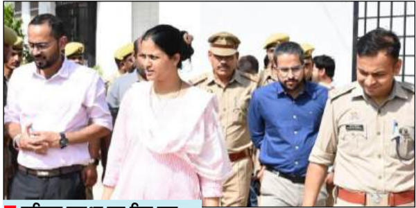
महिला सुरक्षा पर दिए गए सख्त निर्देश

निरीक्षण के दौरान अधिकारियों ने पीड़ित महिलाओं को दी जा रही सहायता सेवाओं की समीक्षा करते हुए कर्मचारियों को निर्देशित किया कि महिलाओं से जुड़ी शिकायतों का त्वरित, संवेदनशील एवं गुणवत्तापूर्ण निस्तारण सुनिश्चित किया जाए। शासन की मंशा के अनुरूप प्रत्येक पीड़िता को हर संभव सहायता