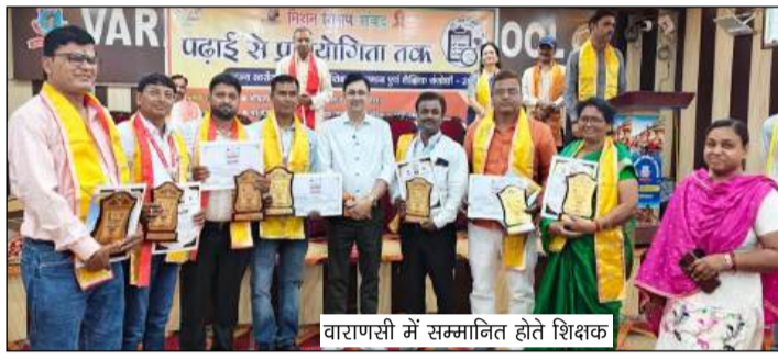
वाराणसी में सम्मानित होते शिक्षक

कुशीनगर। शिक्षा जगत में उत्कृष्ट कार्य कर रहे कुशीनगर के आठ शिक्षकों ने राज्य स्तर पर अपनी प्रतिभा का परचम लहराया है। मिशन शिक्षण संवाद एवं बेसिक शिक्षा विभाग वाराणसी के संयुक्त तत्वावधान में 20 मई 2026 को वाराणसी पब्लिक स्कूल में आयोजित राज्य स्तरीय शिक्षक सम्मान एवं संगोष्ठी समारोह में जनपद के शिक्षकों को विभिन्न श्रेणियों में सम्मानित किया गया। सम्मान मिलने पर जिले के शिक्षकों और शिक्षा विभाग में खुशी की लहर दौड़ गई।