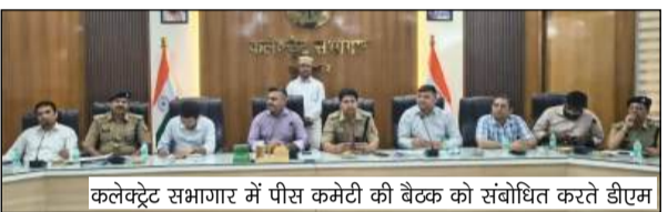
कलेक्ट्रेट सभागार में पीस कमेटी की बैठक को संबोधित करते डीएम