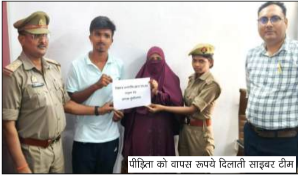
पीड़िता को वापस रुपये दिलाती साइबर टीम

पुलिस के अनुसार एक अज्ञात साइबर ठग ने यूपीआई के माध्यम से पीड़िता के खाते से 2,01,179.94 रुपये ट्रांसफर कर लिए थे। घटना की शिकायत मिलने के बाद साइबर सेल ने तत्काल कार्रवाई करते हुए संबंधित बैंकों से समन्वय